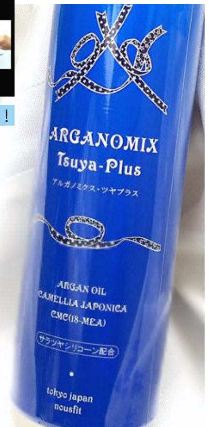
■アルガノミクス・ツヤプラス