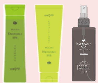
左■ HSシャンプー 300ml@2000円 1L@6000円 中■ HSコンディショナー 250g@2000円 1kg@7000円 右■ カームフィニッシュ(育毛剤) 150ml@4800円 ※価格は全て一般向け税別本体価格

世界的な脳科学の権威、東工大名誉教授武者利光博士が開発した、特別な脳波解析「感性スペクトル」解析により心の状態を確認しながら賦香した香りです。 夏の日差しで疲れた髪と頭皮に、サロンでもご自宅でもニーダブルスパで本格的なヘッドスパをお楽しみください。