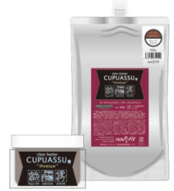
カラーバタープレミアム 200g@1680/店販@2800 900g@4000

初めてカラーバターのビビッドな 色を見て驚いたお客様でも 皆さん喜んでカラーバターを 楽しんでいきます。